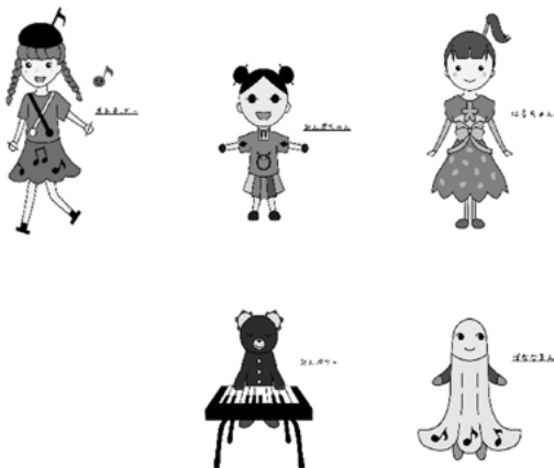
図2 各参加者が作成したキャラクター

深く考えるワークを行った。参加者同士で意見を交換することで新しい視点を取り入れ、キャラクターを完成に近づけた(図2)。