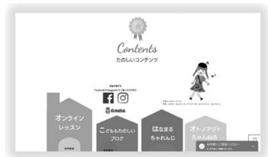
図3 「オトノアジト」のホームページ