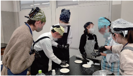
写真2 第5回(2024年3月8日)白玉試作