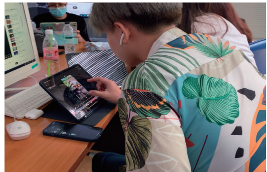
図1 泰日工業大学の学生が映像を編集している様子

彼らとの交流を通じて、日本とタイの若者のキャリア観や考え方の違いを理解し、国際社会でのコミュニケーション能力を向上させ、異文化理解を深めることができた。その言語や文化の壁を超えた共同作業の経験は、参加者たちにとって貴重な学びの場となった。