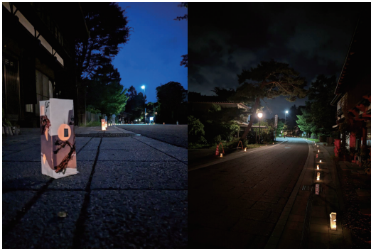
図1・2 点灯後のランタン

ランタンの土台に自由に絵をかいてもらう、色付け、カラーセロファンを貼る等の工程を参加者は行うよう運営した。点灯は完成したランタンの中にキャンドルを入れ、ゼミ生が点灯させる。ランタンは合計約200個を作成し、追分区内の中山道沿いに設置し、約300mにわたり点灯。