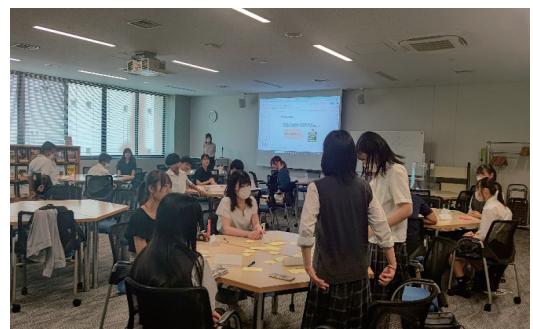
図1 模擬授業体験を行う様子

そして次に、法政大学でのキャンパスツアーの実施である。高校生を実際に本校へ招き、模擬授業体験や学校案内を行った。リアルな大学生活を体験してもらうことで、これまで伝えてきた魅力や情報を「イメージ」から「リアルな感覚」や「憧れ」へと変換してもらえるような企画作りを意識した。