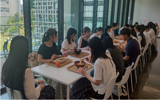
図2 学食で大学生と共に昼食をとる様子