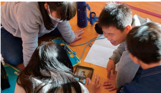
図2 小学生たちが映像内容を考案している様子

また、東日本大震災の被害を受けた四倉とスマトラ島沖地震の被害を受けたアチェの小学校を動画で繋ぐという活動を行った。小学生たちは自分の思いや生活を記録し、動画を通して互いの気持ちをシェアすることで、異文化交流を実現した。さらに、訪問先での撮影を通じて、支援活動を記録し、映像作品として発信することで、被災地の声を広く社会に伝えることを目指した。